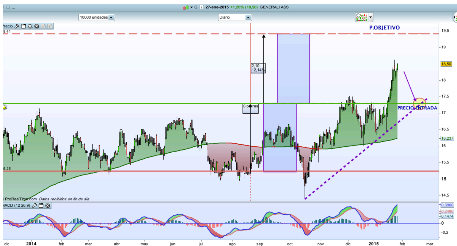
Gráfico diario de Generali Ass.

Con esta entrada fuerte de dinero, el valor este enero ha terminado rompiendo la resistencia que ha estado luchando por romper durante todo el 2014 y, como se puede ver, lo hecho con muchísimas ganas.