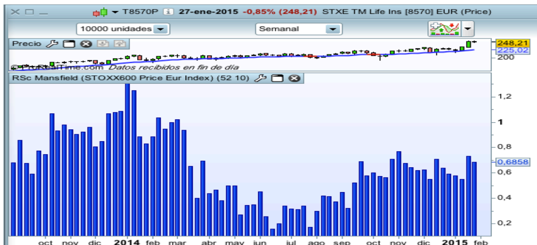
Flujos de capital de Seguros en Europa

Uno de los subsectores más fuertes en Europa es el de Seguros. El dinero lleva mucho tiempo entrando en el sector y no quiere parar. Vamos a buscar un oportunidad en alguna de los valores que forman parte de este subsector.