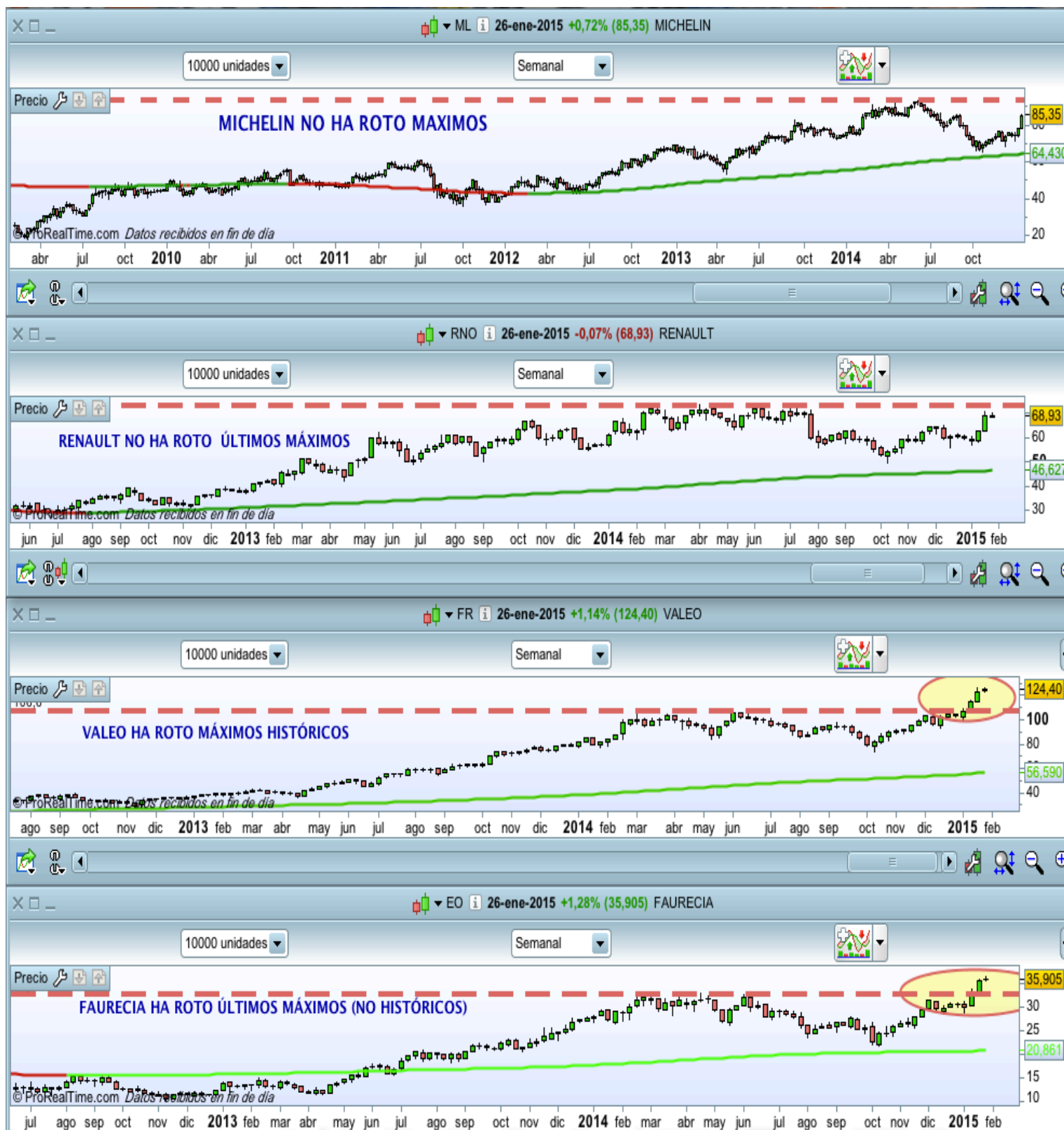
Comparación gráfico semanal Michelin, Renault, Valeo y Faurecia respectivamente