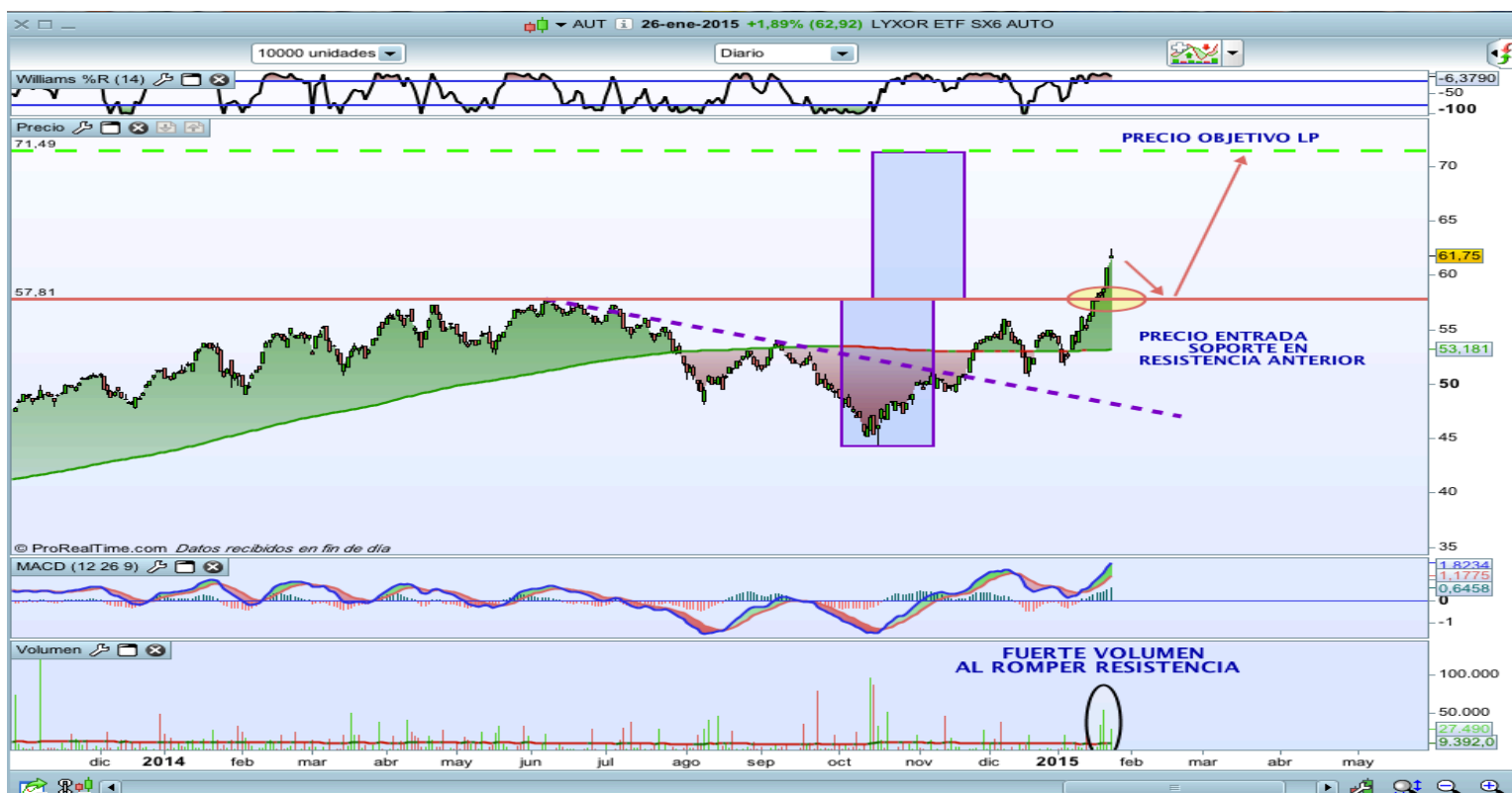
Gráfico diario ETF Stoxx Europe 600 Auto&Parts (AUT)