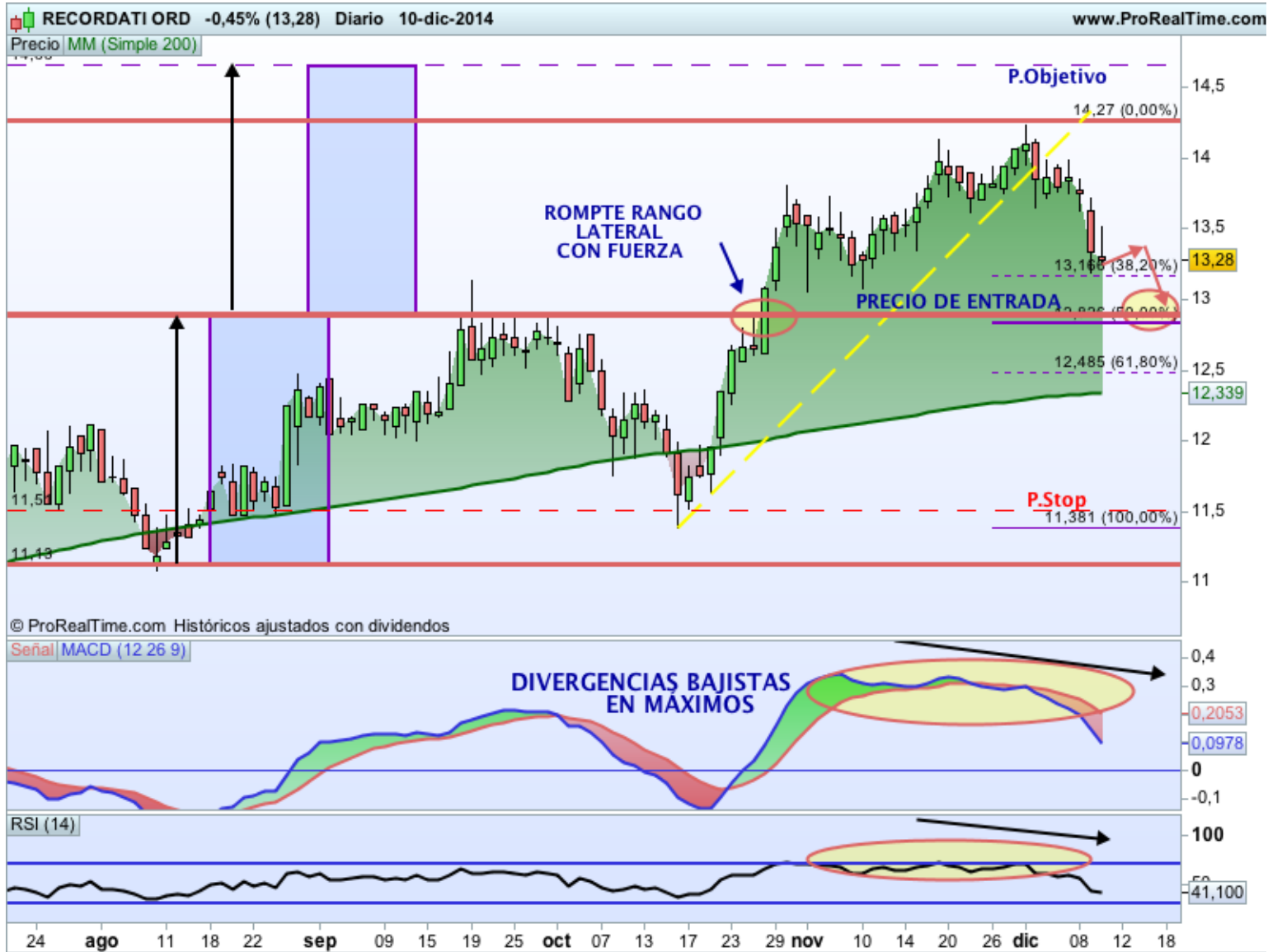
GRÁFICO DIARIO - ESTRATEGIA

El valor ha estado en rango lateral durante todo el 2014. A finales de octubre rompió la parte superior del canal con mucha fuerza. El precio se ha frenado con la ruptura de la directriz alcista del corto plazo y avisándonos con divergencias tanto en el RSI como en el MACD .