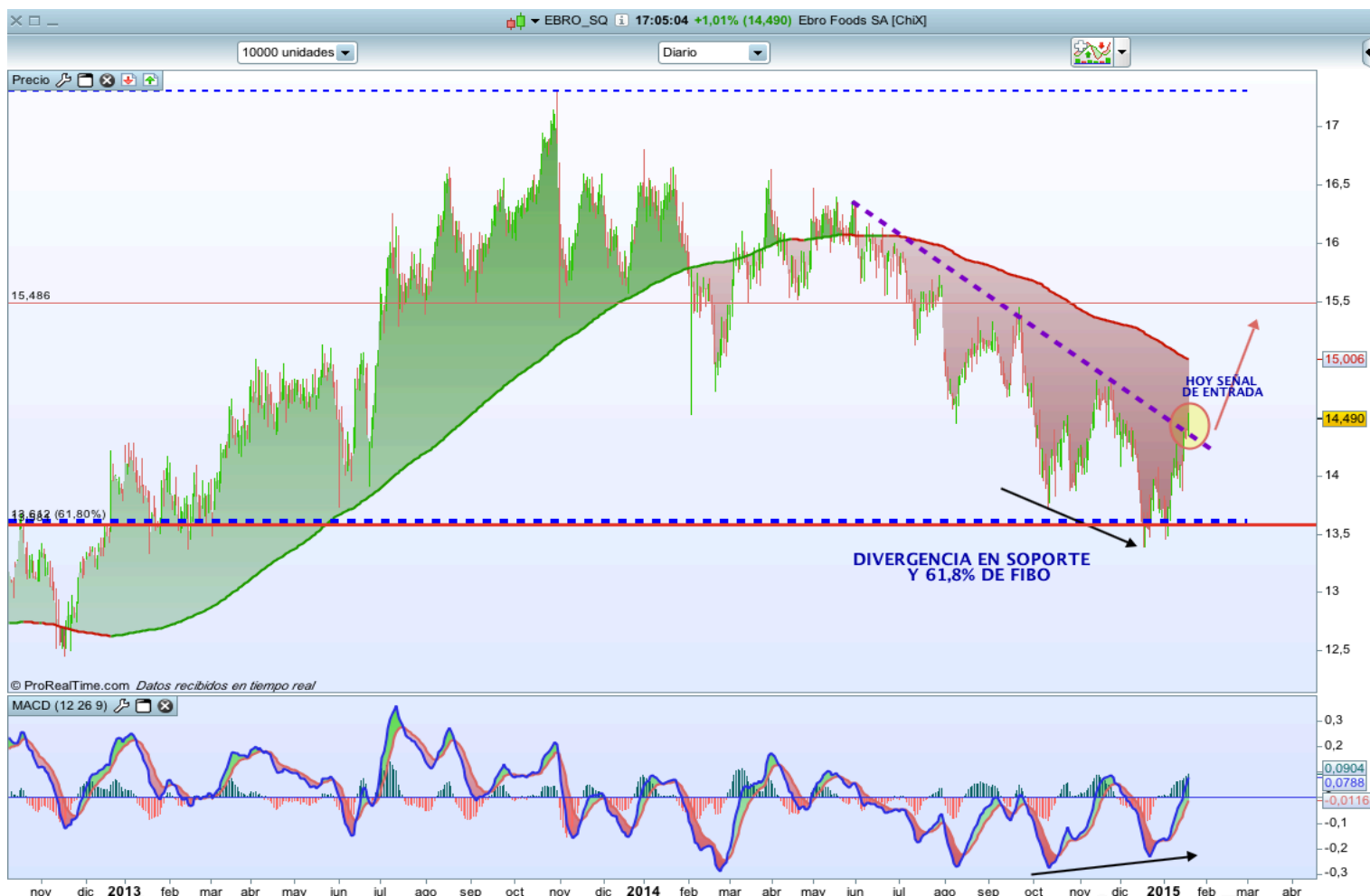
Gráfico diario Ebro Foods

Técnicamente Ebro Foods ayer dio una señal de entrada al romper la directriz bajista que llevaba desde mediados del año pasado, y lo ha hecho después de una fuerte divergencia en un soporte clave; implicación de fin de corrección y cambio de tendencia .