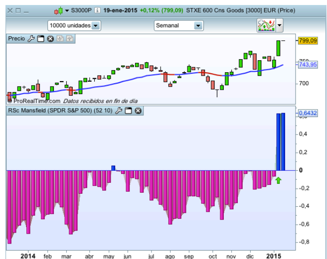
Flujos de Capital Industria Consumer Goods Europa

Lo más probable es que el capital entre para quedarse un tiempo largo. Es un buen momento para detectar valores que puedan aprovecharse de este dinero en su industria para espabilar.