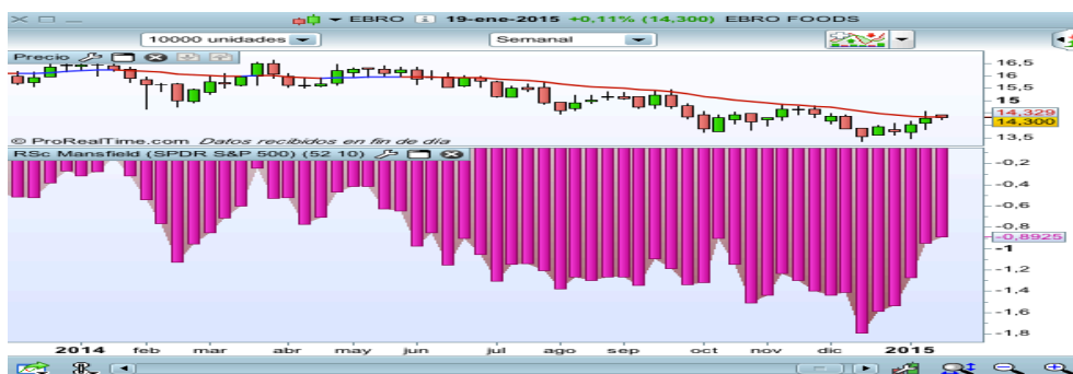
Flujos de Capital de Ebro Foods.

Ebro Foods ha estado muy castigada durante todo el año. Vemos alguna mejora en los flujos, pero aún está muy débil.